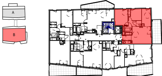
Tableau de répartition des surfaces